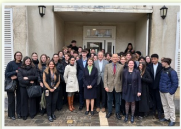
Les équipes de Saint-Thomas-de-Villeneuve

Depuis mi-février, la phase numérique des Olympiades a démarré. Au niveau national, plus de 250 équipes de chacune 8 jeunes lycéens se sont engagées. Pour notre Comité, le Lycée Jeanne d'Albret a constitué une équipe et Saint-Thomas de Villeneuve a montré son exceptionnel dynamisme en proposant 7 équipes ! La deuxième phase se déroulera en présentiel, le 26 mai, au stade Charlety où les partenaires auront chacun un stand. Les équipes choisiront 6 stands où des épreuves les attendront.