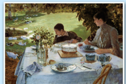
Petit déjeuner dans le jardin (tableau peint à Saint-Germain, rue du Maréchal Joffre)

A l'initiative de l'association saint-germanoïse Italyamo , une plaque commémorative a été apposée, le 17 mai, sur la maison de la rue du Maréchal Joffre où il a résidé.